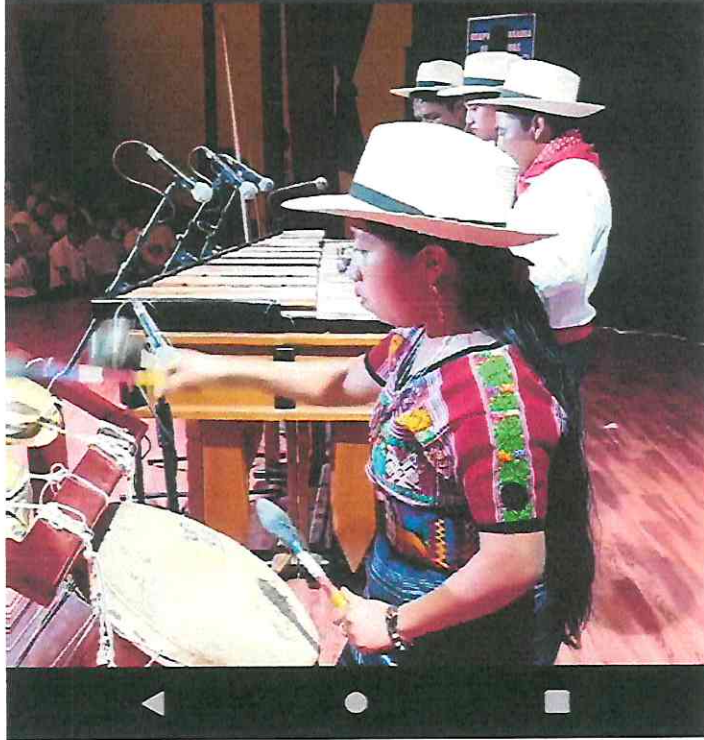
Publicación compartida por la página Oficial del Ministerio de Cultura y Deportes, sobre nuestra primera parcelación en la presentación De la Suite Guatemalteca.

#3milAñosRiquezaCulturalGT #CulturaMotorDesarrolloGT #culturaGUATE