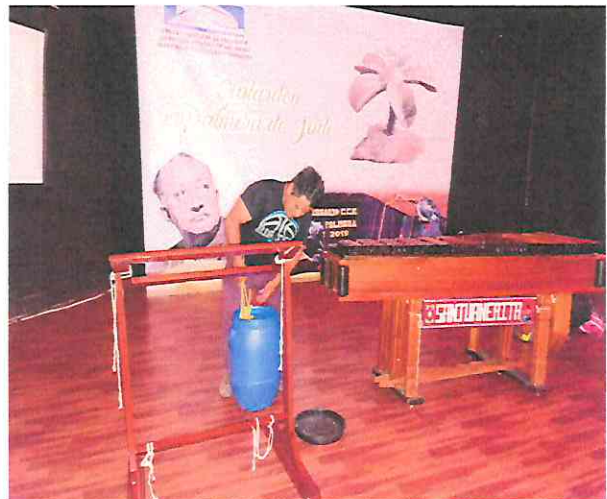
instalación de nuestros instrumentos musicales dentro del centro cultural de Escuintla.