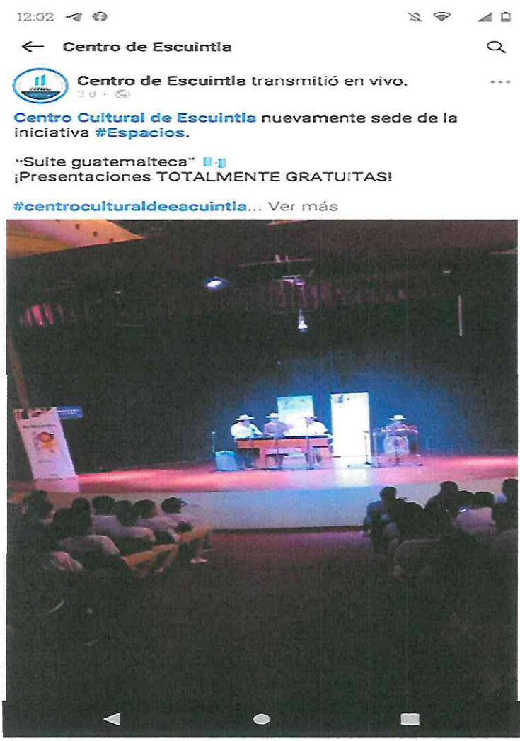
Transmisión en vivo de nuestra segunda presentación en el Centro Cultural De escuintla, presentando la obra Suite Guatemalteca,