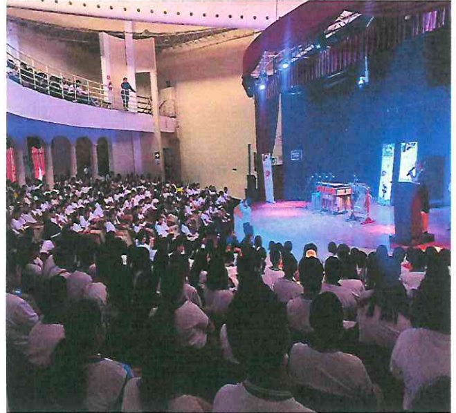
Publico a la espera de la presentación De la obra: Suite Guatemalteca.