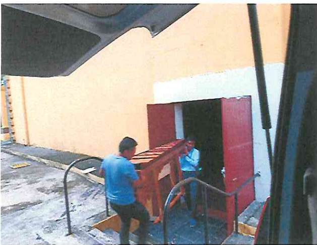
Llegada e ingreso de nuestros instrumentos Musicales al centro cultural de Escuintla.