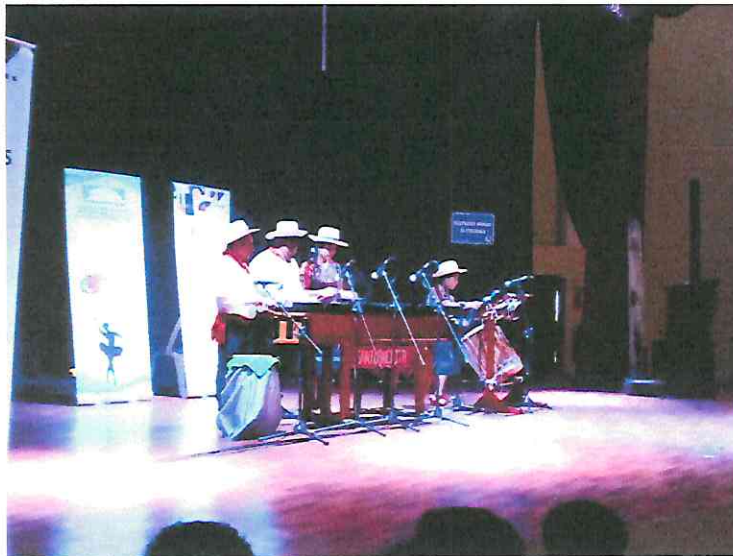
Interpretación de las distintas Obras de la suite guatemalteca.