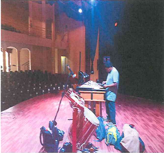
Instalación de microfónía y sonido por parte de los encargados de audio.